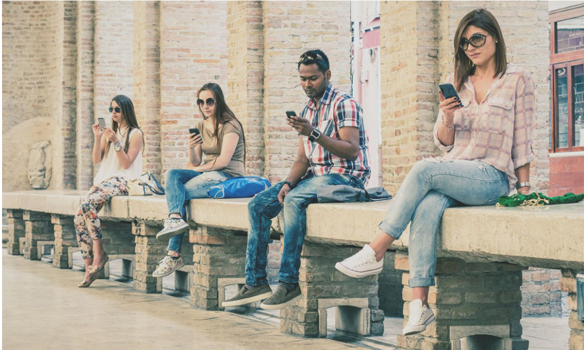
ته كنه لوژيا؛ له خزمه تى مروځه وه بو كونترول كړدى ئيرادهى مروځ

ياسامه ندييه كى ده قبه ستوه كه وهك جوړيك روانى كاريگر ده جوولټ. ليرده ايه ژيان چونتيتى فريوده رانهى خو لى له كيس ددات و سروشت چيتر ره مزى كى نيه له خويدا، به لكوو پر و ليورنزه له نه سته مايه تى و دژوا ريه كان. هه موو شتيك له وان هه مروځ، پيشبينيگر و به راورد كراوه و هم ره وته به رده وام