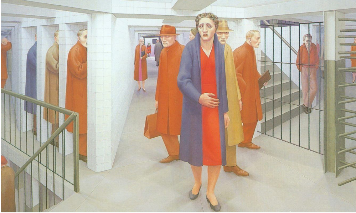
مروّف له سەردەمی تەکنۆلۆژیادا له نامۆ بوون بە خۆی، بە کاری خۆی، بە واقعی کۆمەلگا و سروشت نوقم بووه