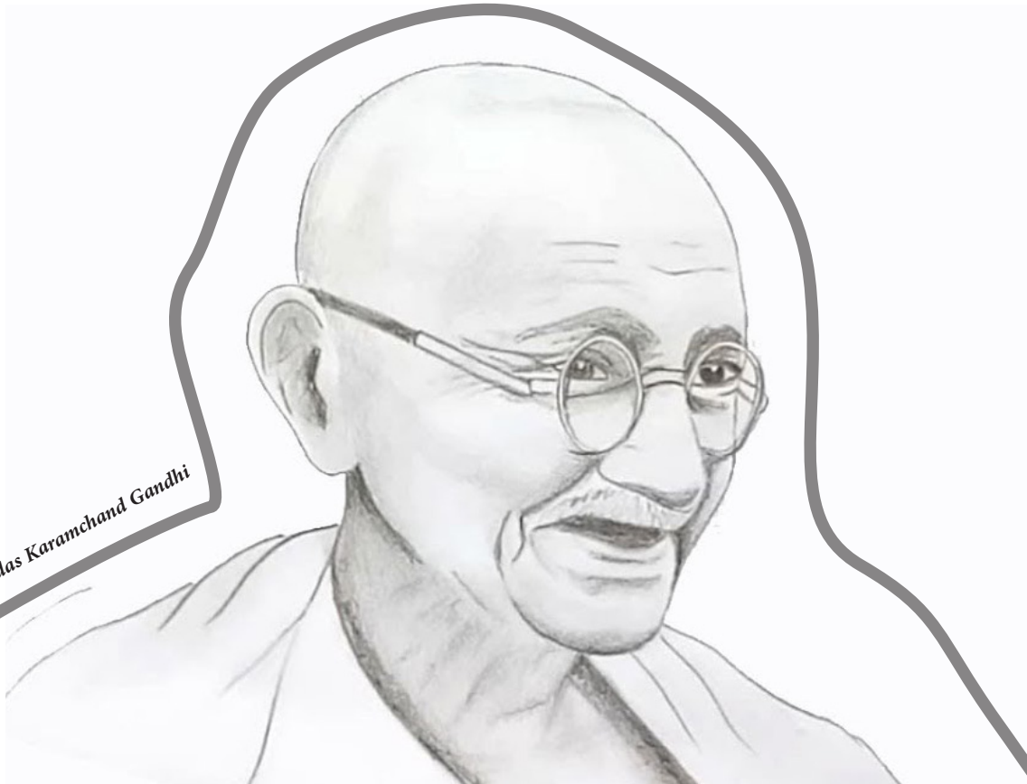
Mohandas Karamchand Gandhi

واقىعەكەى باس كرد. لەكاتىكدا بەرىتانيا پىشەسازى ھىندىستانى ويران كرد، كە زۆر لەوہى بەرىتانيا پىشكەوتووتر بوو. ئەو پىشەسازىيە ويرانكرا. لە ھەمان كاتدا ھىزە كۆلۆنىالەكانى بەرىتانيا دەسەلاتى ئابورىيان بەخشىيە ئەوانەى كە دەسەلاتى سىياسىيان ھەبوو. زەويدارەكان، ئەوانەى كە لە سەرەتاوہ خاوەنى زەوى نەبوون، بەلام لە ھەرئىمە شازادەنشىنەكان باج و سەرانەيان لە خەلگە جوتيارەكە وەردەگرت، بە ھۆى حوكمپرانىي