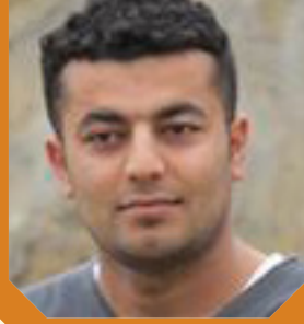
ديار له تيف