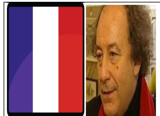
میشال رینۆ ئالای فەرەنسا