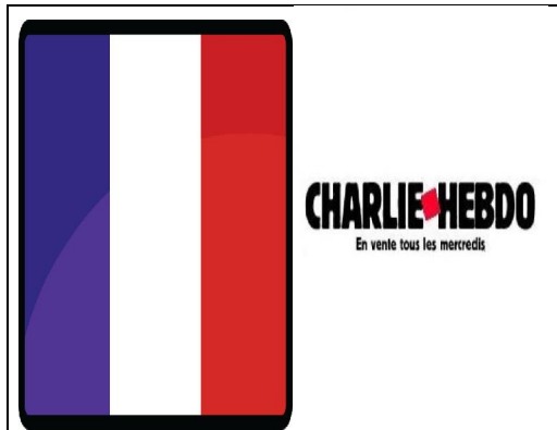
فریدریک بواسۆ ئالای فەرەنسا