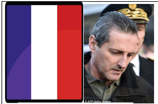
فرانک برینسولارۆ ئالای فەرەنسا