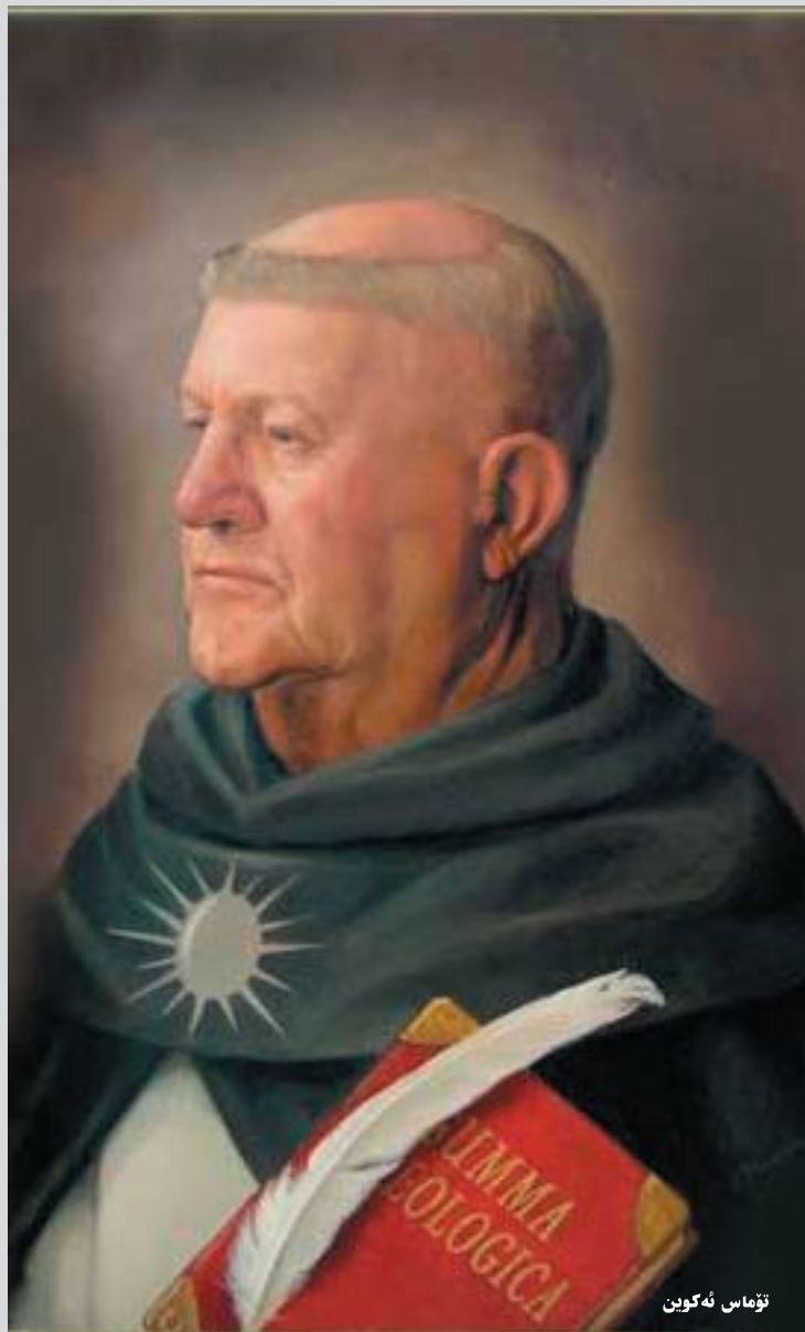
تۆماس ئە ھۆبز

- باسکردن لە بیریۆکە ی نەمری و چەسپاوی کە لە لۆژیکی لایەنگرانیدا خەسلەتی یاسای سروشتین گوتە یەکی ناراستەو واقع بە درۆی دەخاتەو ھە و میژوویش رەتیدە کاتەو، چونکە تەنھا ژینگە ی کۆمەڵایەتی سەرچاوە ی یاسایە و بە ییپی کات و شوینیش دەگۆریت، ئیتر چۆن دەشیت یاسا لەسەر یە ک بار بچەسییت و بپینتەو ھە. - باسکردن لەو ھە ی عەقلی مرۆف بنەماکانی