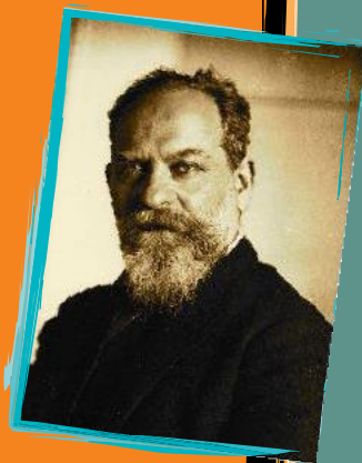
بىنەما بىنەرەتتېيەكانى مېتۇدەي فېنۇمېنۇ لۇژى