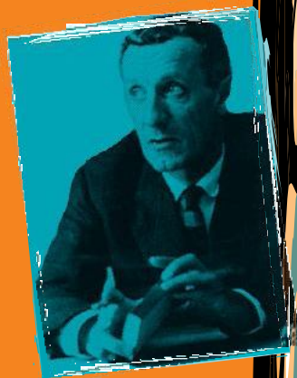
لەش و بوون لە فەلسەفەي مىرلۇ بۇنتىدا