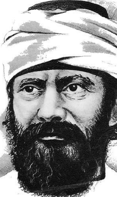
محمد مد عه بده

قهيرانى کؤمه لگه کانى رؤژه لائت، ماويه کى زؤر پيش هاننى ئيسيعمار بؤ ئەم به شى جيهان ده سئپيکر دبوو، به لام تاگايى له م قهيرانه له ته نجامى کار يگه رى روبه روو بوونه وه له گه ل سه ربازانى شارسانتئى نوئى کشانگير بوو. ئيسنا بؤيان