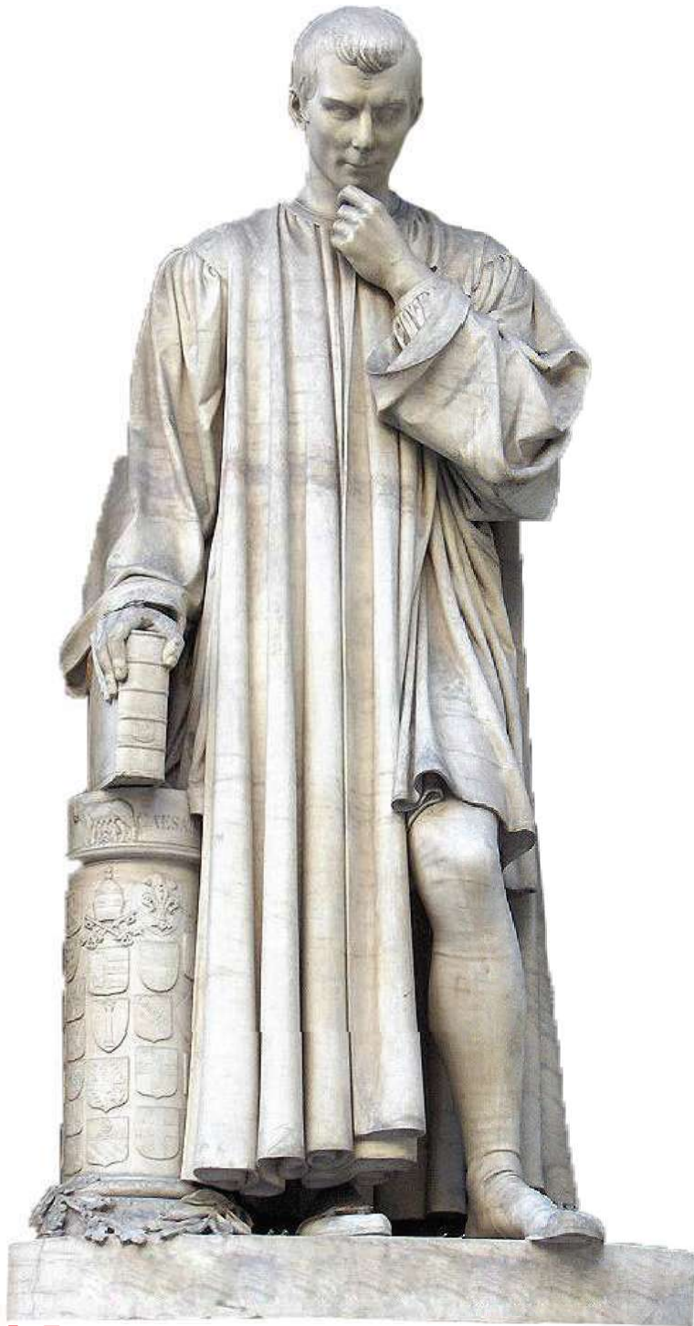
N I C C O L O M A C H I A V E L L I