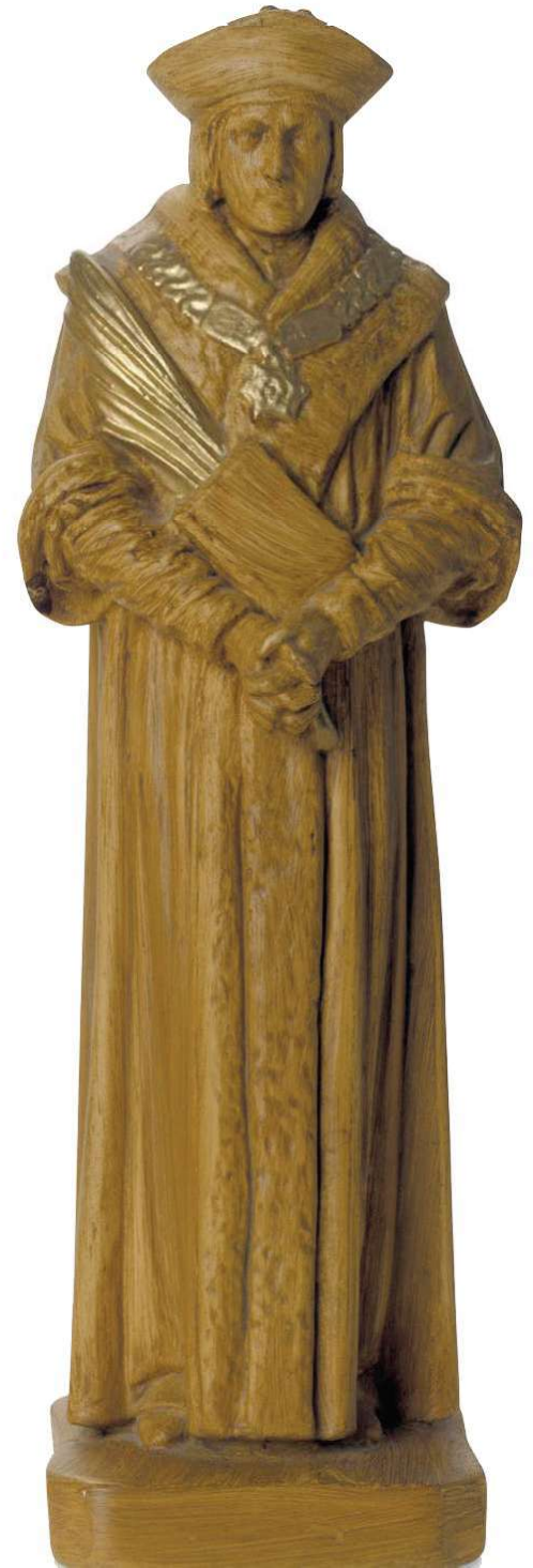
T H O M A S M O R E