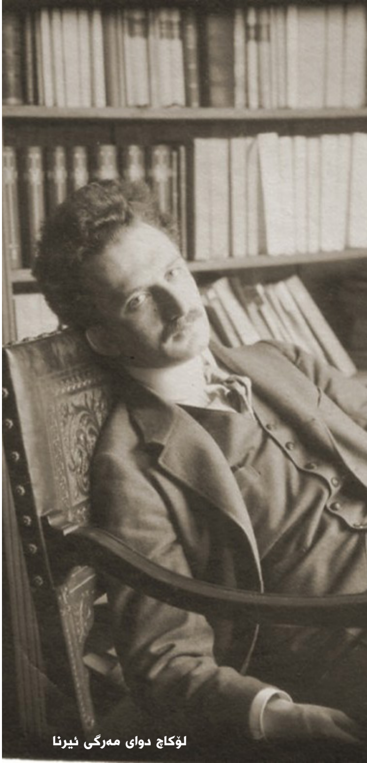
لۆكچا دوای مەرگی ئیرنا

• 18 ی نۆشەمبەر: نووسینی وتارەكەى دەربارەى (پىچارد پىیر ھۆفمان) دوادەخات و لەبرى ئەو «سەرگوزەشتەى شا میداش» دە نووسیت .