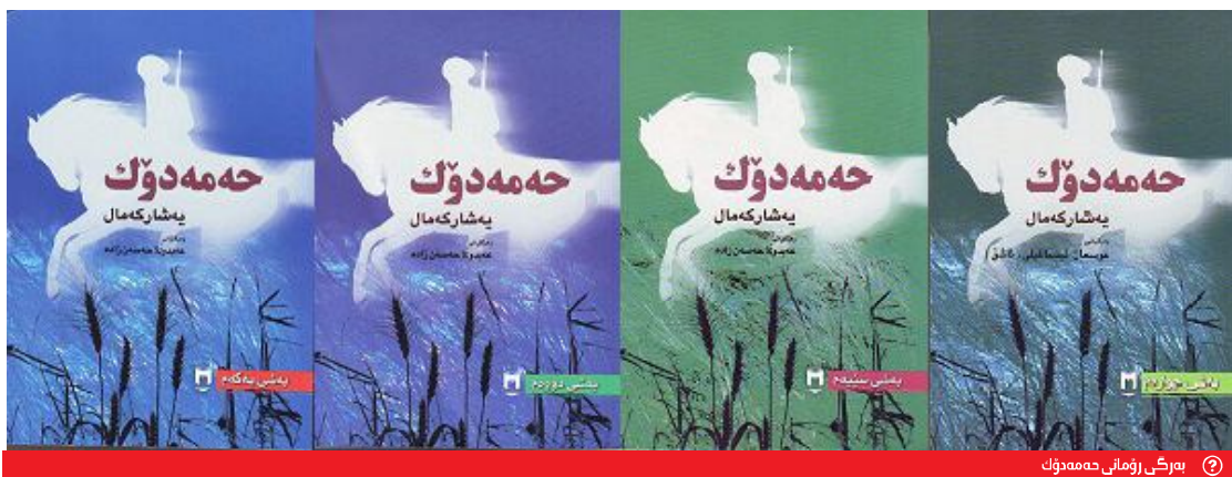
② بەرگى زۇمانى چەمەدۇك

زارى چەتەكانى لادىكەى خۆى بىستوو يەتى. «سەلمانى تەنيا»ش لەسەر بىنەماى كوشتنى باوكى يەشار لە چىرۆكى مندالىكى ھەتيودا كە سالى 1915 بەخپوى كردوو، ئەو كوشتنى كە يەشار خۆى لە تەمەنى 5 سالىدا شا يەتى بوو.