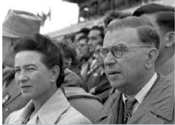
سارتەر و ديبۇقۇر

دى بۇقۇر: زۆر لەو شتانەیان پینخۆش نەبوو من گوتبووم، ھەزدەكەن باوەر بکەن کە تەواوی قۇناغەکانی ژیان سەرخۆشانەيە و